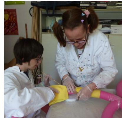
Δ Exposition pour les JO