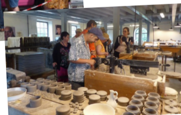
Δ Visite Moulin de la Blies