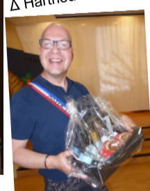
Δ Election Miss et Mister été