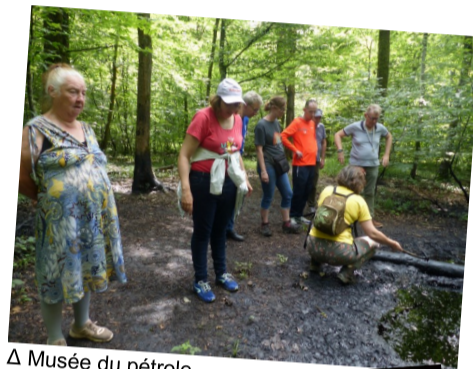
Δ Musée du pétrole