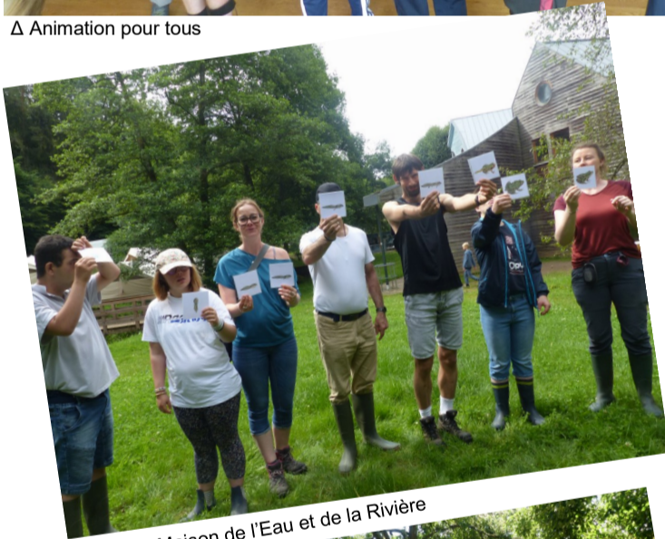
Δ Sortie Maison de l'Eau et de la Rivière