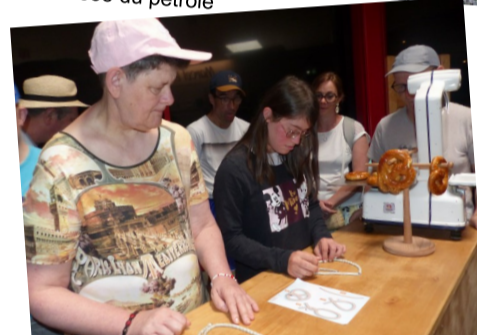
Δ Fabrique à Bretzels