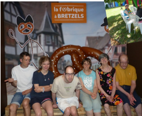
Δ Fabrique à Bretzels