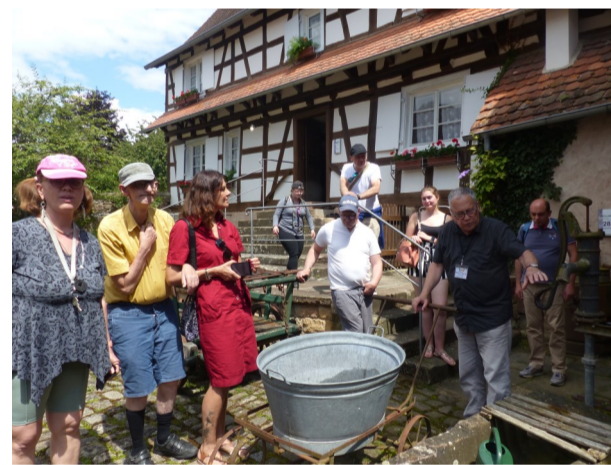
Δ Sortie Maison Rurale de l'Outre Forêt