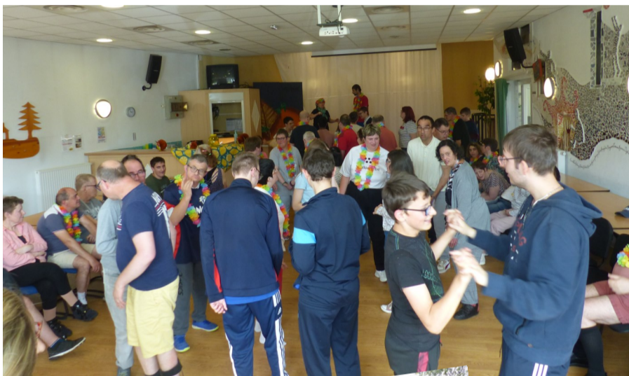
Δ Animation pour tous

L'été au Picasso a été un moment festif avec de nombreuses fêtes et plusieurs sorties : animation pour tous « Spécial été », Election de Miss et Mister été, Harthouse'Plage, sortie au musée du Pétrole, sortie à la Maison de l'Eau et de la Rivière, plusieurs sorties à la Fabrique à Bretzels, sortie à la Maison Rurale de l'Outre Forêt, sortie au Moulin de la Blies. Il s'est achevé avec la venue du Foodtrucks Sylvia's Glaces le vendredi 30 août de 15h00 à 16h30 et le jeudi 19 septembre de 14h30 à 16h00 devant la salle polyvalente !