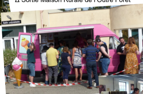
Δ Foodtruck glaces